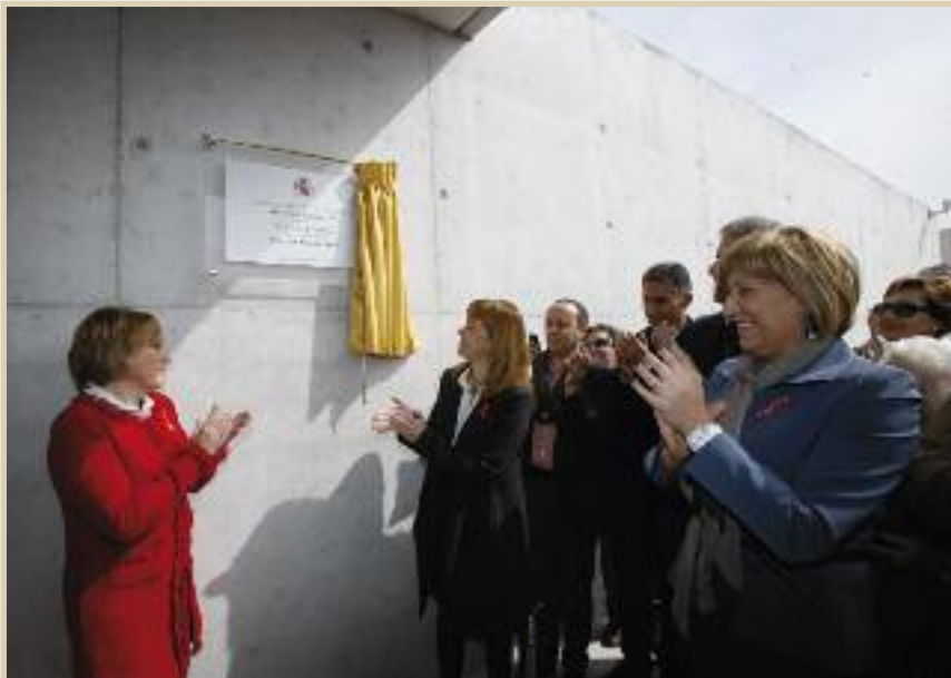
Momento en el que se desvela la placa conmemorativa del Centro de Día.