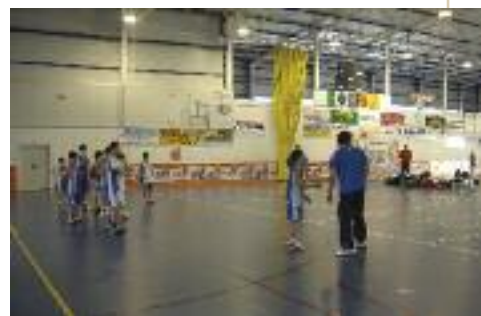
Juegos escolares.

Como en ediciones anteriores, en estos VIII Juegos Escolares Sax-Salinas los alumnos jugarán en las disciplinas de baloncesto y voleibol, siendo la novedad este año el tradicional juego de “campo muerto”. En baloncesto se disputarán tres categorías: alevín masculino; benjamín y alevín femenino; y benjamín mixto. Mientras, voleibol y “campo muerto” sólo cuentan con una categoría, alevín mixto y benjamín mixto respectivamente. Durante la clausura, el próximo 8 de abril, se celebrarán diversos campeonatos de tiros libres para los participantes y uno especial para los padres y madres. •