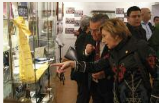
Inauguración de la exposición en el CEAHM.