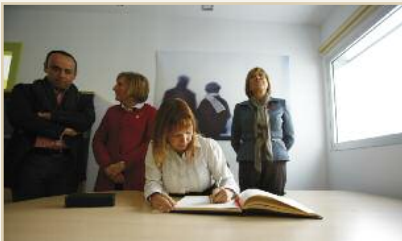
La ministra firma en el Libro de Oro del Ayuntamiento.

aseguró que su departamento está ultimando las plazas en virtud de las solicitudes realizadas dentro de la última convocatoria de la Administración autonómica. Y aunque no concretó el número de plazas, ratificó que se tiene constancia de la solicitud efectuada por el Ayuntamiento de Sax y se mostró confiada en que el Centro de Día y Residencia de Sax concierte, “el mayor número posible de plazas”.