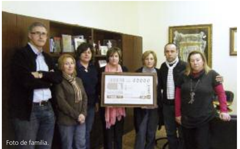
Foto de familia.

El acto de entrega se realizaba en el Ayuntamiento de Sax, con la presencia, además, de otros miembros del equipo de Gobierno. •