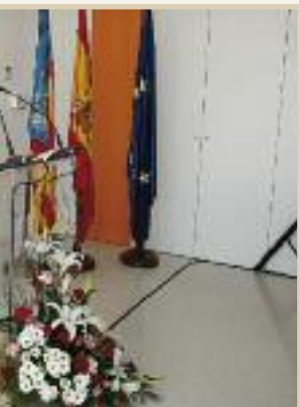
Barceló y Pajín

aseguró que su departamento está ultimando las plazas en virtud de las solicitudes realizadas dentro de la última convocatoria de la Administración autonómica. Y aunque no concretó el número de plazas, ratificó que se tiene constancia de la solicitud efectuada por el Ayuntamiento de Sax y se mostró confiada en que el Centro de Día y Residencia de Sax concierte, “el mayor número posible de plazas”.