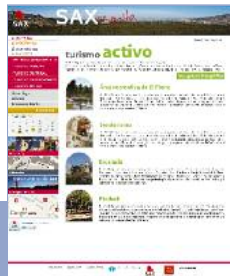
Vista de las páginas de turismo familiar y turismo activo