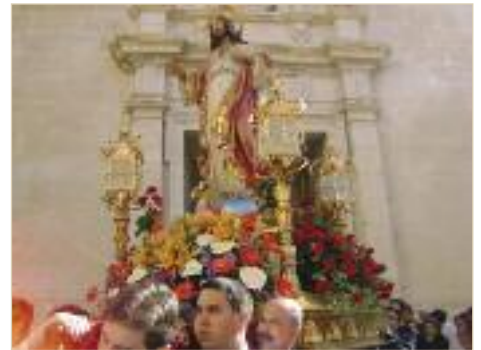
Pasos de la procesión.

mentos, tanto en percusión como en viento". De hecho, la banda cuenta ya con treinta percusionistas y cuatro músicos con instrumentos de viento. "Pensamos que con nuestra banda estamos aportando un granito de arena a la cultura musical de nuestro pueblo", concluyó.