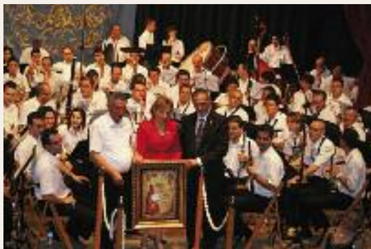
Entregan del diploma conmemorativo de su 25 Aniversario.