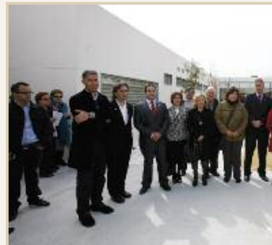
Personalidades que asistieron a la inauguración del Centro de Día.

Por su parte, la alcaldesa agradeció su visita a la ministra Pajín y la hizo extensiva al Ejecutivo, “por permitir que una pequeña comunidad como Sax cuente con un centro de día como éste”. La primera edil añadió que “es precisamente en momentos así cuando uno se siente partícipe