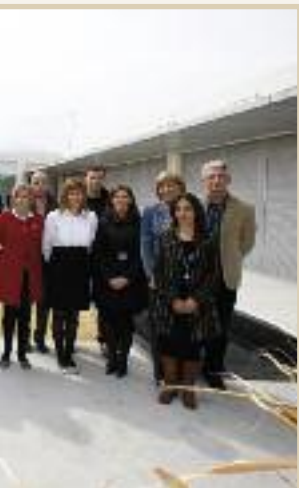
Centro de Día.