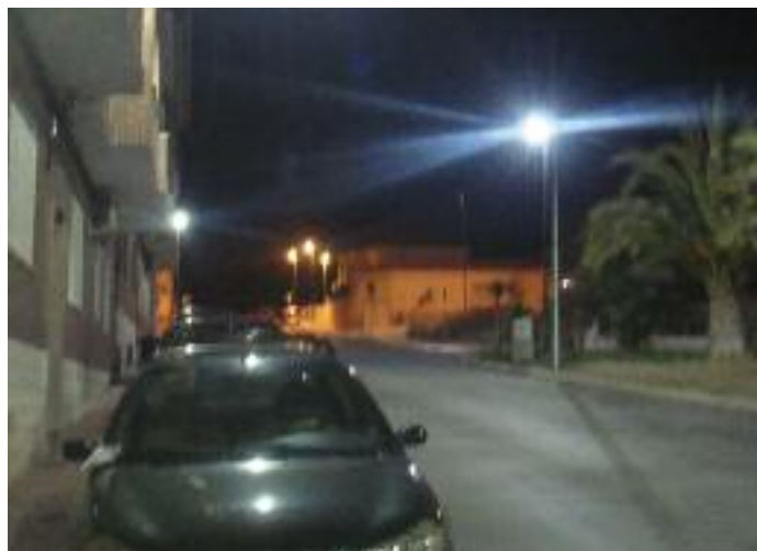
Nueva iluminación LED en la calle Honduras.

Pero además, los cambios han aportado al barrio, añadía Cuenca, “un aspecto más moderno y bien iluminado”. •