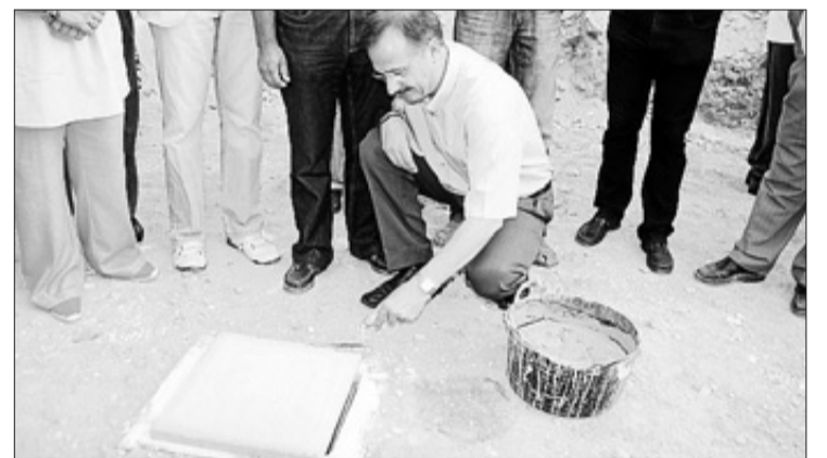
El alcalde de Novelda en la colocación de la primera piedra.